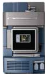
XEVO TQ-XS XEVO TQ-S micro XEVO TQD