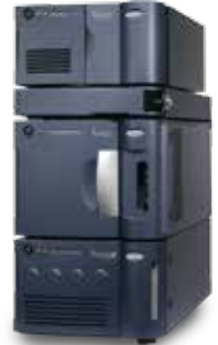
ACQUITY H-CLASS BIO