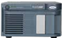
ACQUITY QDa SQ Detector 2