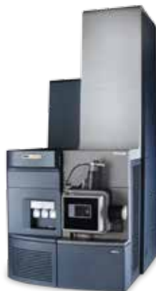
XEVO G2-XS QToF XEVO G2-XS Tof