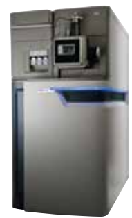
SYNAPT G2-Si HDMS SYNAPT G2-Si MS