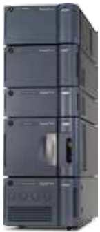
ACQUITY UPC 2